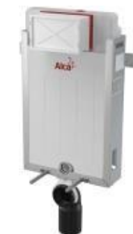
Unibox-Renovmodul splach. syst. pro zadržování předstěn. inov. vč. dávkovače