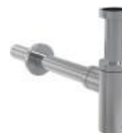
Přísl. sifon umyvadlový kov chrom kulatý