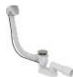
Přísl. sifon vanový aut. chrom