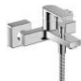
Vernis Shape baterie vanová páková chrom na stěnu