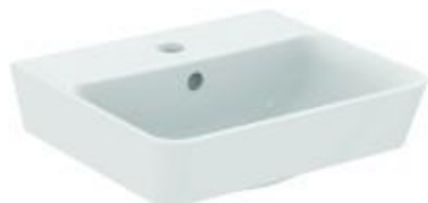
Ideal Standard Connect Air Cube umyvadlo lotv. bílá 60