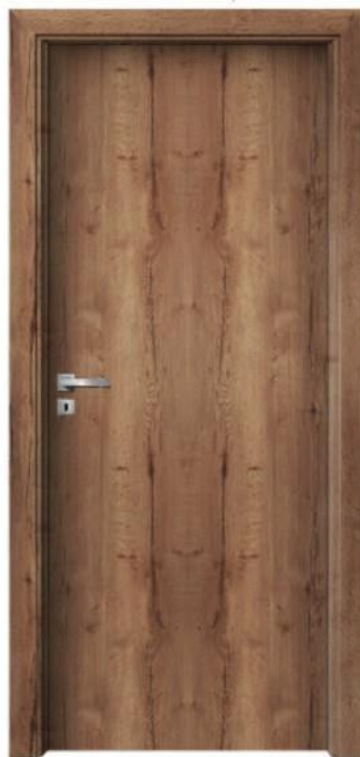
CPL Dub Halifax tabákový