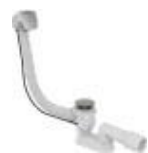
Přísl. sifon vanový aut. chrom