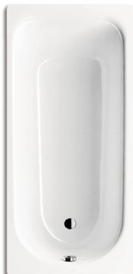
Vana Saniform plus