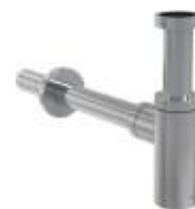
Přísl. sifon umyvadlový kov chrom kulatý