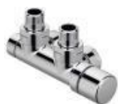
Přísl. Set P armatura rohová 1/2", s reg.hlavicí vpravo, chrom