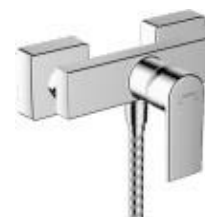
Baterie sprchová páková chrom. na stěnu