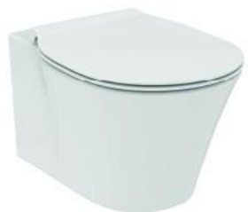
Ideal Standard Connect Air sedátko ultra ploché soft-close bílá