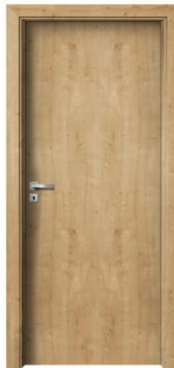
CPL Dub sukatý