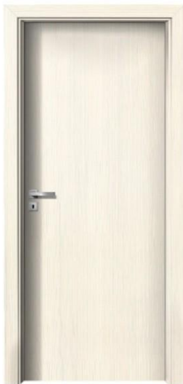
CPL jasan pískový

VÝBĚR DEKORŮ ŘADY KAPPA, PŘÍPLATKOVÁ VOLBA