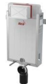
Unibox-Renovmodul splach. syst. pro zadržování předstěn. inov. vč. dávkovače