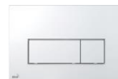
SUM ovládací tlačítko pro představené instalační systémy chrom/lesk