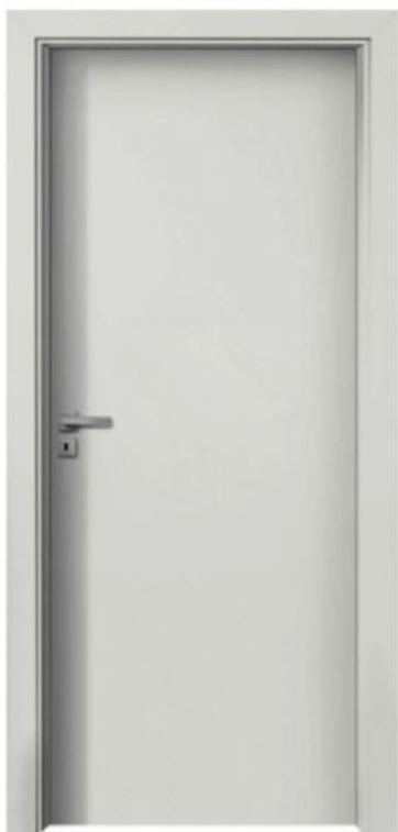
CPL diamantově šedá

VÝBĚR DEKORŮ ŘADY KAPPA, PŘÍPLATKOVÁ VOLBA