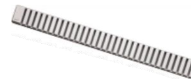
Podlahový rošt LINE