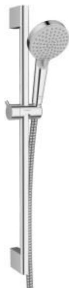
Sprchová sada chrom se sprch.tyčí 65 cm