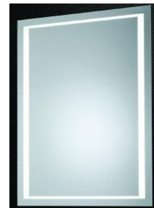
Square zrcadlo 80×60