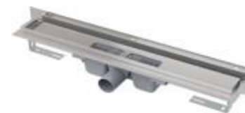
Podlahový žlab APZ4